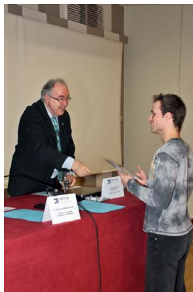
Premio al mejor expediente académico de Ingeniería Técnica Industrial 2011-2012

Para finalizar el acto, en las dependencias del Colegio, se invitó a todos los asistentes a un vino español que permitió el intercambio de impresiones y el acercamiento de los nuevos profesionales a la institución colegial. En este acto fueron distinguidos con nuestro emblema un total de 41 nuevos compañeros.