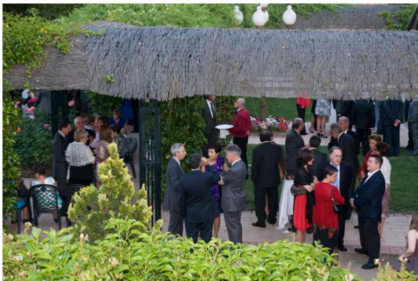
Cóctel en los jardines del Hotel La Vega

Este año, la tradicional Fiesta Colegial se celebró brillantemente el día 15 de junio en el hotel La Vega (Arroyo de la Encomienda), con una importante asistencia de colegiados, junto a sus acompañantes. Asistieron asimismo representantes de otros colegios y personalidades invitadas.